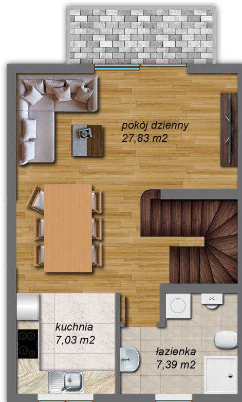
I poziom 42,94 m 2