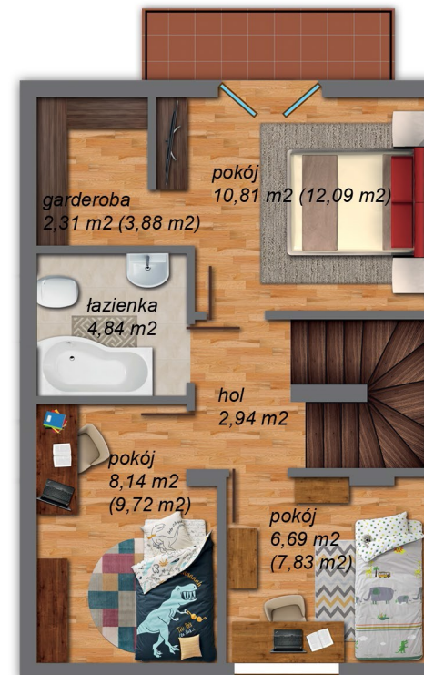
II poziom 42,94 m 2 (46,27 m 2 )