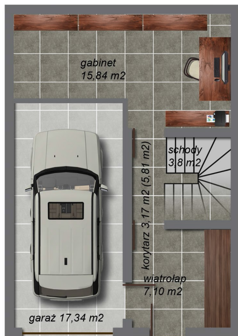
Parter 47,05 m 2 (49,69 m 2 )