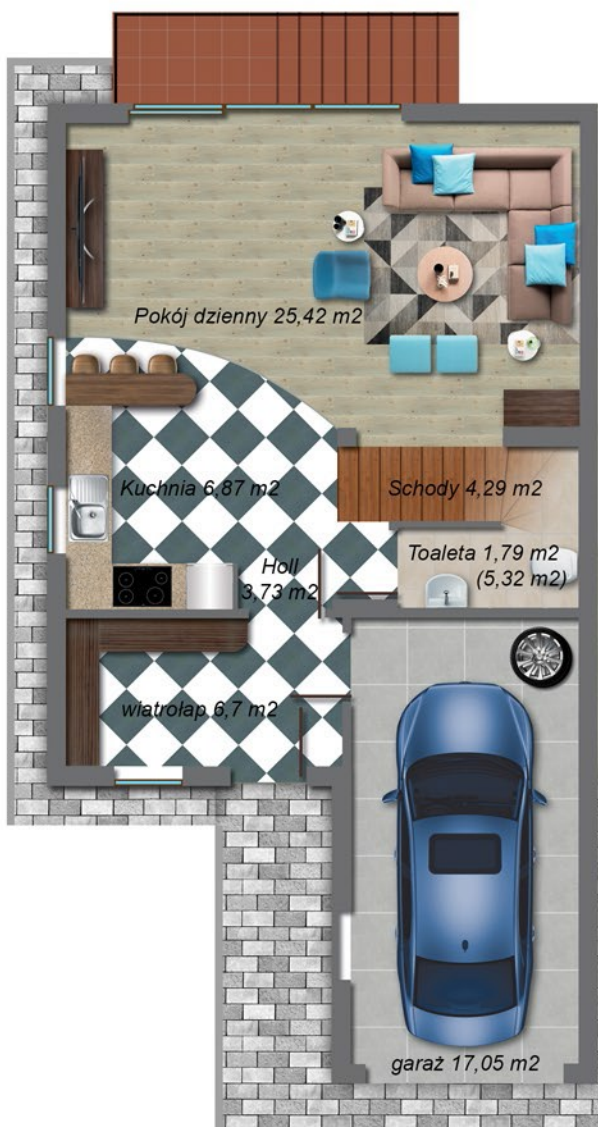
Parter 65,85 m 2 (69,38 m 2 )