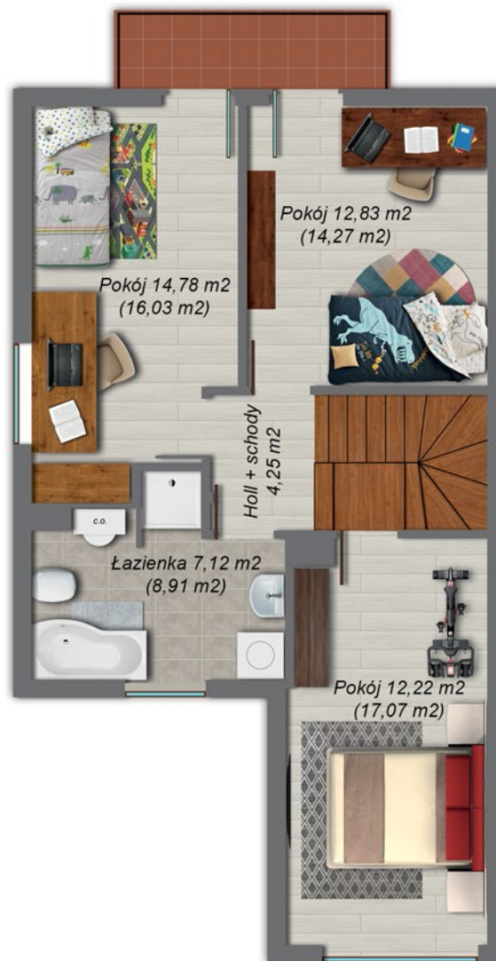
Poddasze 51,20 m 2 , (60,53 m 2 )