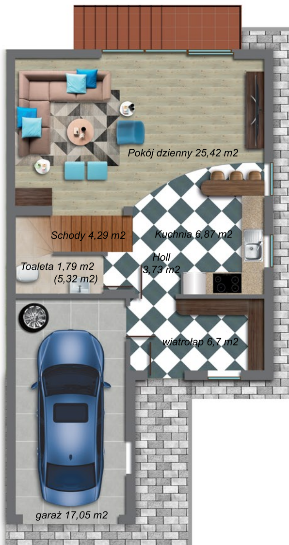
Parter 65,85 m 2 (69,38 m 2 )