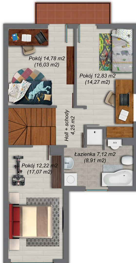
Poddasze 51,20 m 2 , (60,53 m 2 )